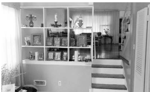
改装前の玄関周り

「インテリアのセンスがある友達に周りにいけば助かるのに」と日頃から思っていた。デザイナーがプロの知識を教えてくれたり、技術的な質問にも答えてくれたり、探しているものが見つかりそうなサ